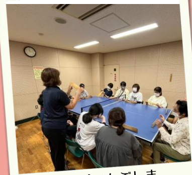
ハートピアかごしま 施設見学・体験