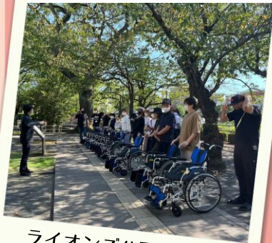
ライオンズ公園にて 屋外実習(車イス)