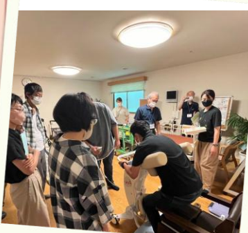
介護実習・普及センター 福祉体験教室