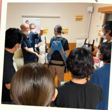
介護実習・普及センター 福祉体験教室