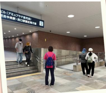
鹿児島中央駅にて 屋外実習(白杖)