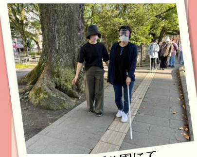
ライオンズ公園にて 屋外実習(白杖)