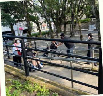
ライオンズ公園にて 屋外実習(車イス)