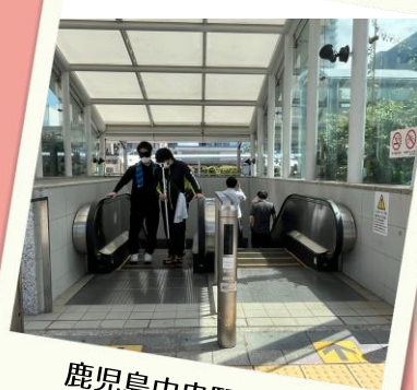
鹿児島中央駅にて 屋外実習(白杖)